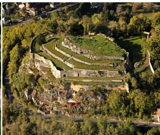
Vue prise en Octobre 2014

Les remparts : Dans l'attente des directives de la DRAC concernant le château du Roy, nous avons décidé de porter plus particulièrement notre effort cette année 2014 sur les remparts qui entourent la bastide.