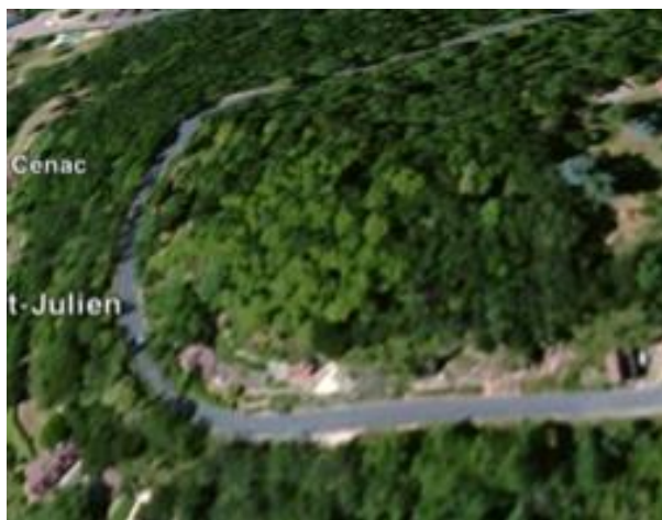
Vue du château avant 2010

Il est évident que l'un des éléments déterminants pour poursuivre ces travaux sera la capacité financière de notre association. C'est dans cette optique que celle-ci a mis en place une petite équipe de réflexion pour rechercher des financements. D'autant que, devenue depuis fin 2013 association d'intérêt général, 66% de la valeur des dons faits à l'ASBDR sont déductibles des impôts.